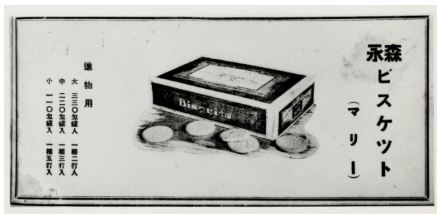
▲1923年発売当時の「マリー」

しかし、まだまだ高級品だったビスケットは一般の人が簡単に手に入れられるものではありませんでした。そこで、3年後の1926年に、より多くの人にビスケットを食べていただけるようにと、ボール紙にワックスを塗ったパッケージが考案され、その第一号としてマリーが選ばれました。