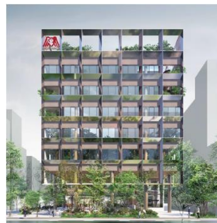
(仮称)森永製菓芝浦ビルの外観イメージ

本発行により調達された資金は、(仮称)森永製菓芝浦ビルの建替え費用に充当する予定であります。建替えにあたりましては、CO 2 排出量の削減など環境に配慮し、「ZEB Ready」の認証取得を見込む環境共創型オフィスとして計画しております。また従業員が働きやすく、多様な人材の活躍を推進するため、バリアフリー設備や、ジェンダーフリーに利用できる SOGI トイレ、ダイバーシティを推進するための祈祷室や働く女性のためのエンゼルルームの設置、地域企業や地域住民のための災害発生時の避難場所を設けるなど、企業理念と 2030 ビジョンを体現するオフィスを志向してまいります。