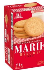
▲現在の マリービスケット