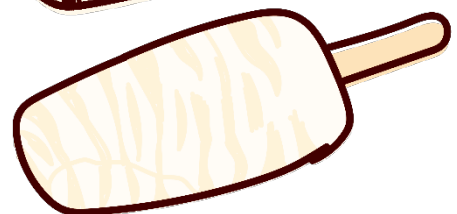
▲上：しましまうまうまバー 下：消えたしましまうまうまバー