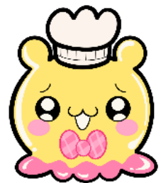
新ブランドキャラクター 「ぜらちい」

「森永クックゼラチン」は、溶けやすく口どけがいい顆粒タイプのゼラチンでお菓子作りから普通の料理にもお使いいただくことができ、王道のゼリーだけではなくグミやマシュマロ、ジューシーなお肉料理やパラパラ炒飯にもおすすめです。小分けになっているので使いやすく、料理にさっと入れて混ぜるだけでお手軽にコラーゲンが摂取できます。「ぜらちい」が紹介する「森永クックゼラチン」でお客様においさと笑顔をお届けしてまいります。