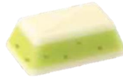
種入りのつぶつぶ食感が楽しいチョコ