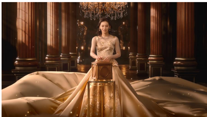
〈「贅沢ビスケット 金の女神」篇より〉

贅沢ビスケットシリーズの新たなラインアップとして発売される「チョコをまとった贅沢ムーンライト」と「チョコをまとった贅沢チョイス」は、「森永ビスケット」シリーズの中でも人気のムーンライトとチョイスをミルクチョコレートでフルコーティングした贅沢な味わいのチョココンビネーションビスケットです。新たに公開される CM では、“贅沢”という商品のコンセプトそのままに、金のドレスを身にまとった北川景子さんが登場します。ビスケットを食べようと秘密の宝石箱に手をかける北川景子さん。すると箱の中からチョコをまとったビスケットが浮き上がり、まさに“金の女神”の世界観が表現された内容になっています。撮影終了後のインタビューで語った北川景子さんの意外な贅沢時間、そして甲乙つけ難い贅沢ムーンライトと贅沢チョイスどちらが好きかの回答にも是非ご注目ください。