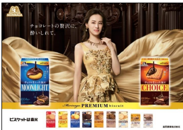
〈メインビジュアル〉

また、9月24日（火）より森永ビスケットシリーズのイメージキャラクターで女優の北川景子さんが出演する新 CM「金の女神」篇を全国でオンエアします。