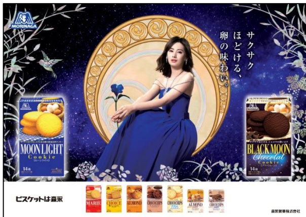
〈メインビジュアル〉

森永製菓株式会社(東京都港区芝浦、代表取締役社長・太田 栄二郎)は、森永ビスケットシリーズのイメージキャラクターで女優の北川景子さんが出演するムーンライトの新CM「ミュシャの実写篇」を10月8日（火）より全国でオンエアします。尚、今回のCMは、ミュシャ財団初のミュシャの世界観を実写化したCMとなっており、ミュシャと北川景子さんの美しすぎるコラボレーションにご注目ください。