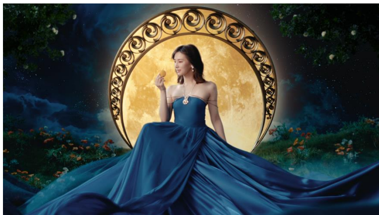
〈「ムーンライト ミュシャの実写篇」より〉

「ムーンライト」は、サクサクほどける食感や卵のコクのある味わいが特徴のクッキーで、「森永ビスケット」シリーズの中でも人気の当社を代表する主力商品です。そんなムーンライトと19世紀末から20世紀初頭に活躍。アール・ヌーヴォーを代表し、新国立美術館での展覧会が年間来館者数 No.1 も記録した人気画家 ミュシャとのコラボレーションが実現。