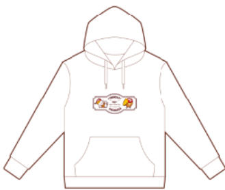
ポチャッココース