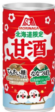
▲「甘酒 北海道限定仕込み」

※2 インテージ SRI+甘酒市場（2023年11月～2024年10月累計販売金額）