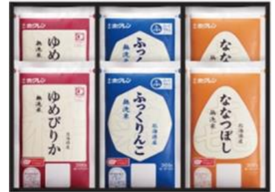
▲3 缶コース「北海道米プレミアムギフト」

WEB 応募 URL： https://ap.morinaga.co.jp/enquete/index/amazake_shukan_2411