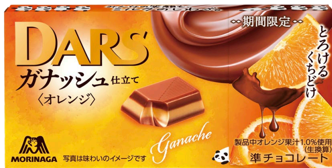
▲ダースガナッシュ仕立て<オレンジ>