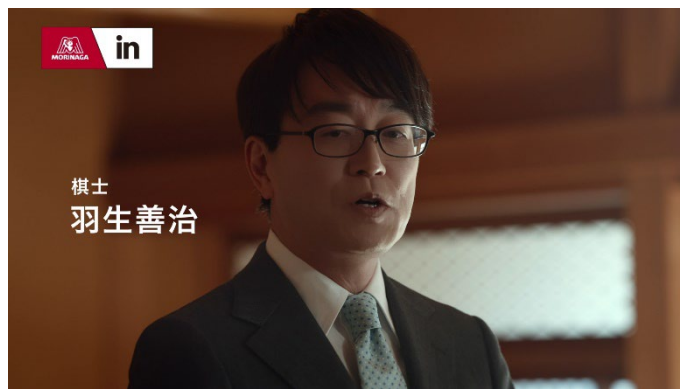
羽生善治九段出演の「羽生棋士と将棋」篇

久保建英選手出演の「久保選手に挑戦」篇は、久保選手が披露するサッカーのトリックに子どもたちが挑戦したり、一緒にミニゲームをしたりする様子を描きました。憧れの久保選手とサッカーをする子どもたちの一生懸命な姿や、挑戦を楽しむ笑顔が印象的なCMです。